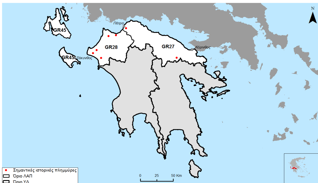
Σχήμα 2.1: Σημαντικές ιστορικές πλημμύρες ΥΔ Βόρειας Πελοποννήσου (GR02)

Όσα συμβάντα ανήκουν στις κατηγορίες "υψηλή" ή "πολύ υψηλή" χαρακτηρίζονται ως "σημαντικά" ιστορικά γεγονότα σύμφωνα με τα οριζόμενα στην Οδηγία 2007/60/ΕΚ και στην Κοινή Υπουργική Απόφαση (Κ.Υ.Α.) Η.Π. 31822/1542/Ε103/2010 (ΦΕΚ 1108 Β'/21.07.2010) και με βάση αυτά, στην παρακάτω εικόνα παρουσιάζονται οι θέσεις των σημαντικών ιστορικών πλημμυρών για τα διάφορα υδατικά διαμερίσματα.